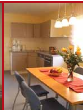
von links: Aufenthaltsraum mit Küche Einzelzimmer im Ferienhaus Küche der Ferienwohnung